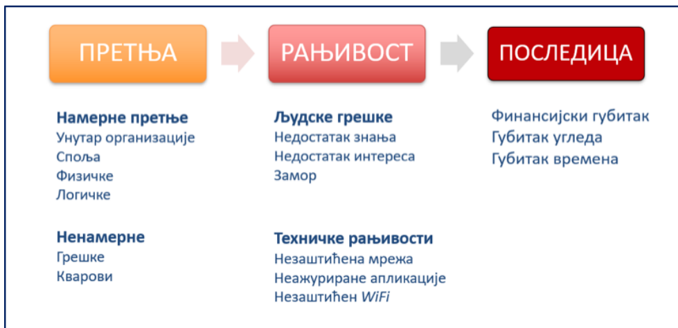
Слика 1 - Настанак безбедносних инцидента

Ризик је комбинација последица неког догађаја (укључујући и промене у околностима) и повезане вероватноће настанка. У контексту информационе безбедности, ризици по безбедност информација могу се изразити као ефекат несигурности на циљеве безбедности информација.